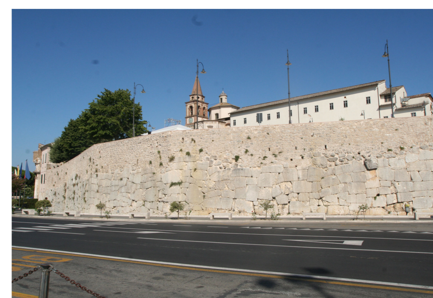
IL CENTRO STORICO DI AMELIA E LE COLLINE, I CENTRI DI LUGNANO IN TEVERINA, GUARDEA E MONTECCHIO CON GLI ULIVETI E I VIGNETI